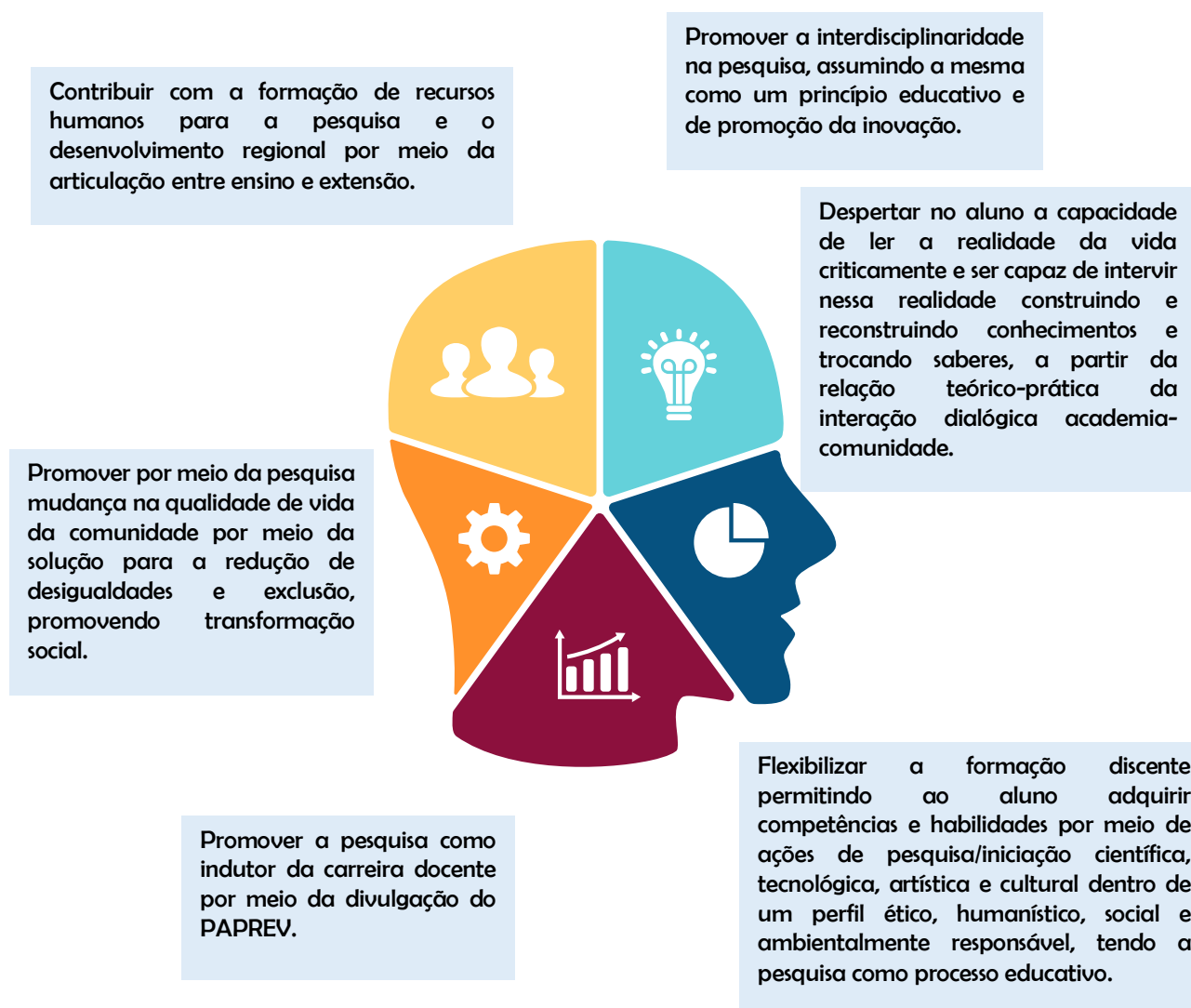
Figura 2: Objetivos da Pesquisa, Inovação Tecnológica e desenvolvimento Artístico e Cultural